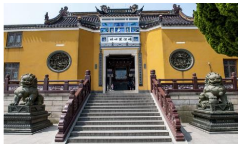
『紫竹林-不肯去觀音院』

『紫竹林-不肯去觀音院』：紫竹林是觀音修道的地方，裡面有全山建寺最早的地方不肯去觀音院。因山中岩石呈紫紅色，剖視可見柏樹葉、竹葉狀花紋，因稱紫竹石，後人在此栽有紫竹而得名。