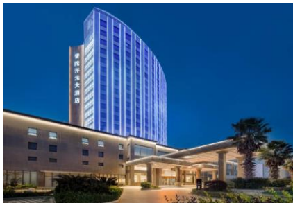
『舟山普陀開元大酒店』