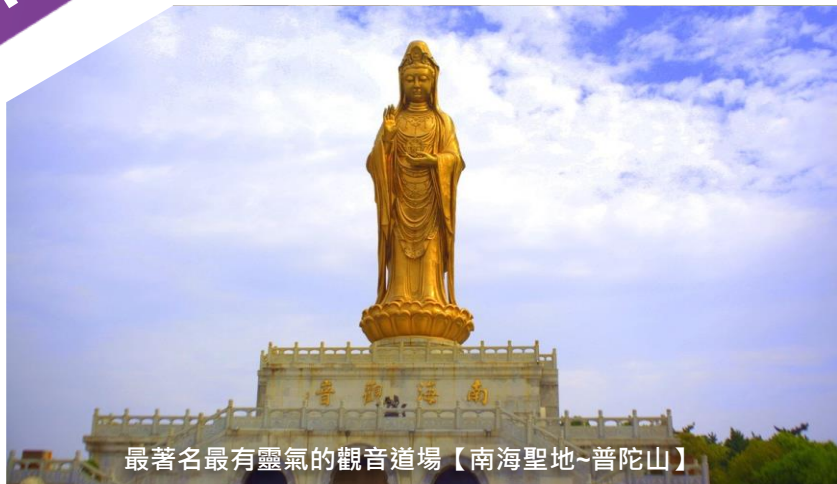
最著名最有靈氣的觀音道場【南海聖地~普陀山】

※ 專業貼心服務~全程食住玩安排妥善、預留充足自由活動時間令團友盡情享受 ※ 【當地專屬配車·由經驗充足的服務人員同行下，讓您體會一個舒適安心的旅程】