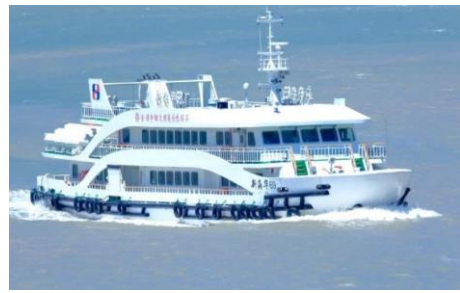
『朱家尖至普陀山』約15分鐘船程